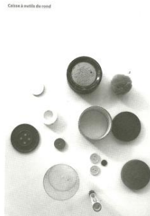
Ex : caisse à outils du rond