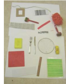
Ex : caisse à outils du trait